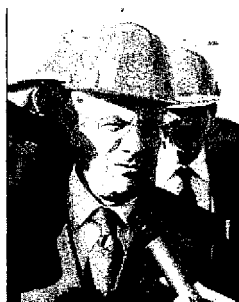
A sinistra il ministro Claudio Scajola e in basso il presidente della Cir Carlo De Benedetti